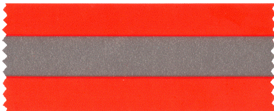
На текстильной основе

По утверждению специалистов, самое подходящее место, где стоит разместить световозвращатель – это грудь и бёдра, но чаще люди предпочитают прикреплять световозвращатели на кисти рук, свои портфели или сумочки. Самый оптимальный вариант, когда на пешеходе находится как минимум 4 световозвращателя.