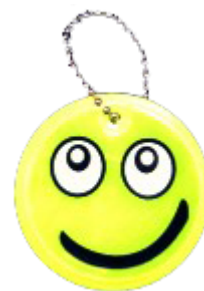
На поливинилхлоридной основе (ПВХ)