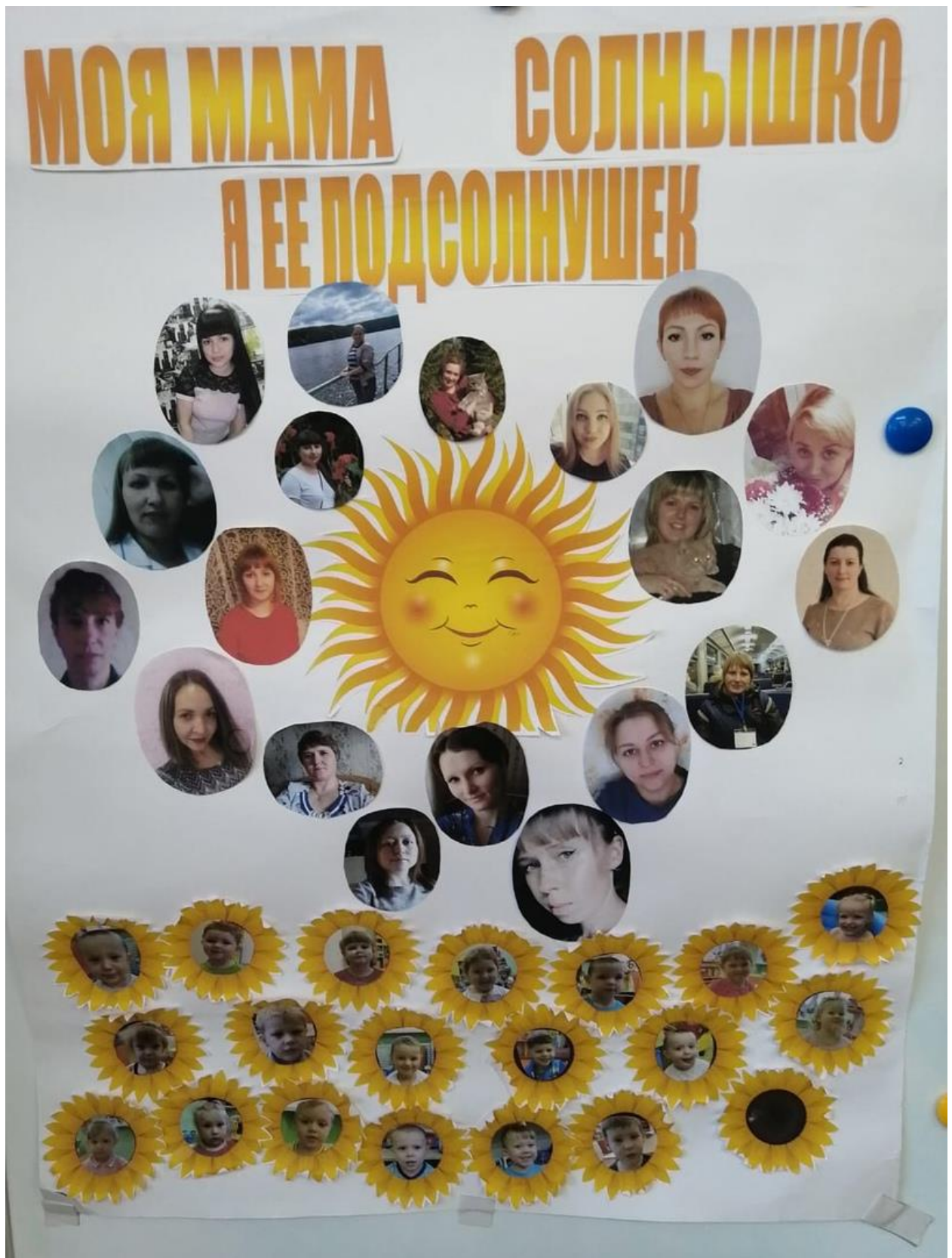
Фотовыставка «Моя мама солнышко – я ее подсолнушек»