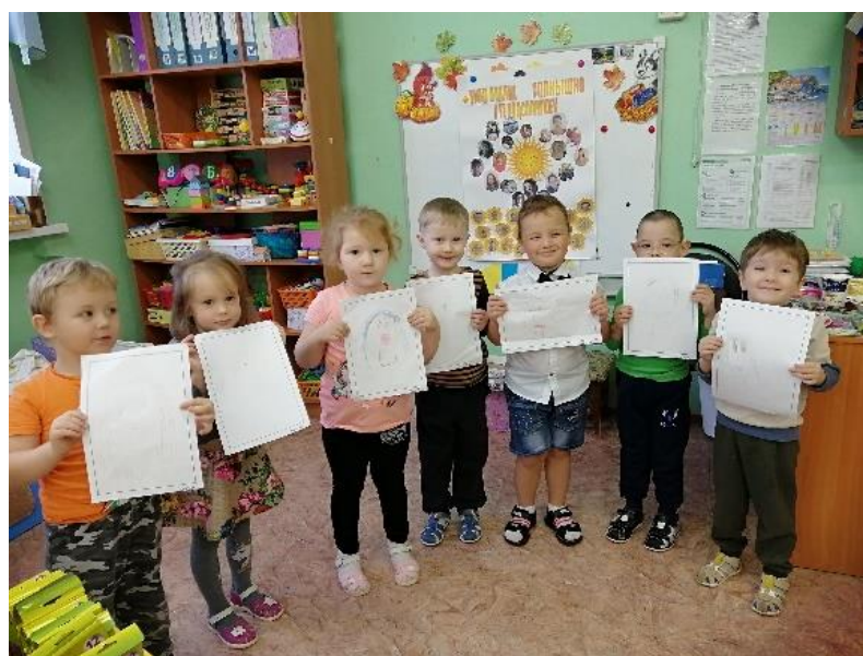
Рисование «Милой мамочки портрет»