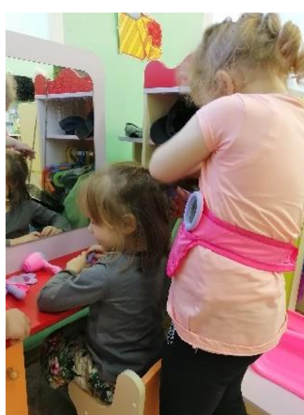
Сюжетно-ролевые игры «Семья», «Салон красоты»