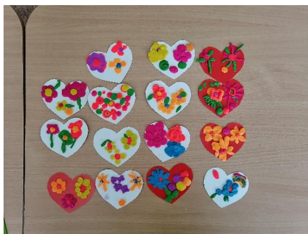
Пластилинография «Брошка для мамы»