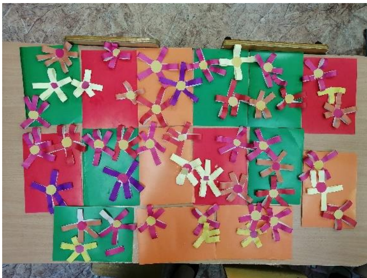
Подарки «Открытка для мамы»