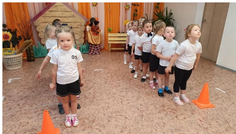
Спортивное развлечение, посвященное Дню Матери