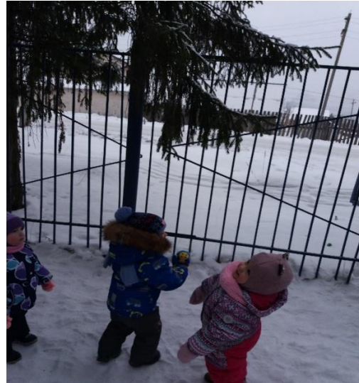
Ель в инее