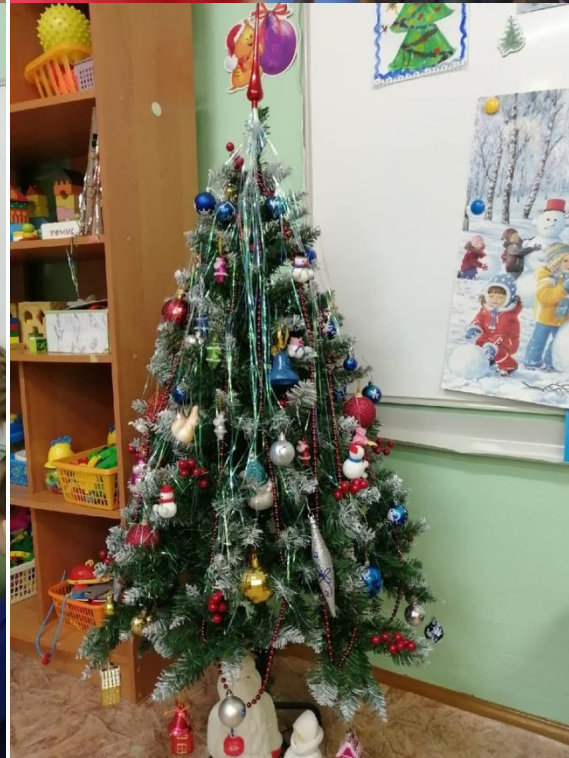
Украшение ёлки в группе