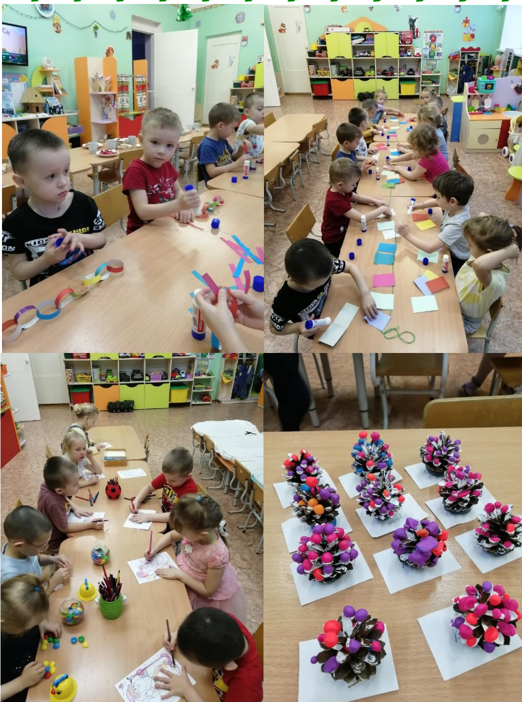
Конструирование из бумаги «Праздничные флажки», раскрашивание раскрасок, творческая мастерская «Сувенир – нарядная ёлка»