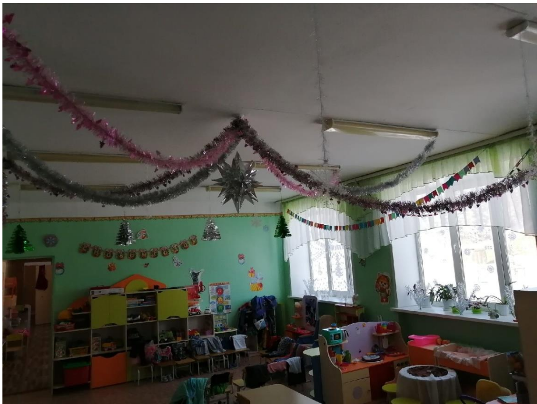
Украшение групповой комнаты