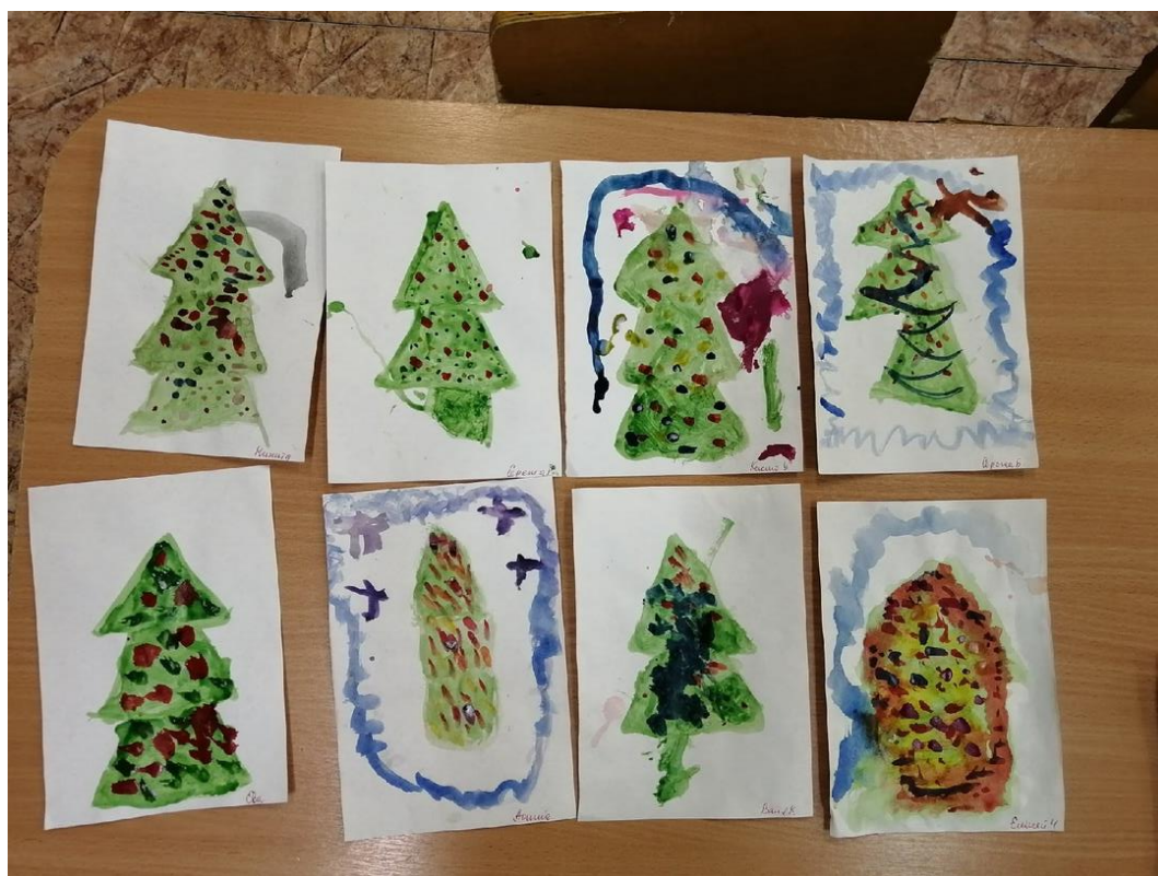
Рисование «Наша ёлка»