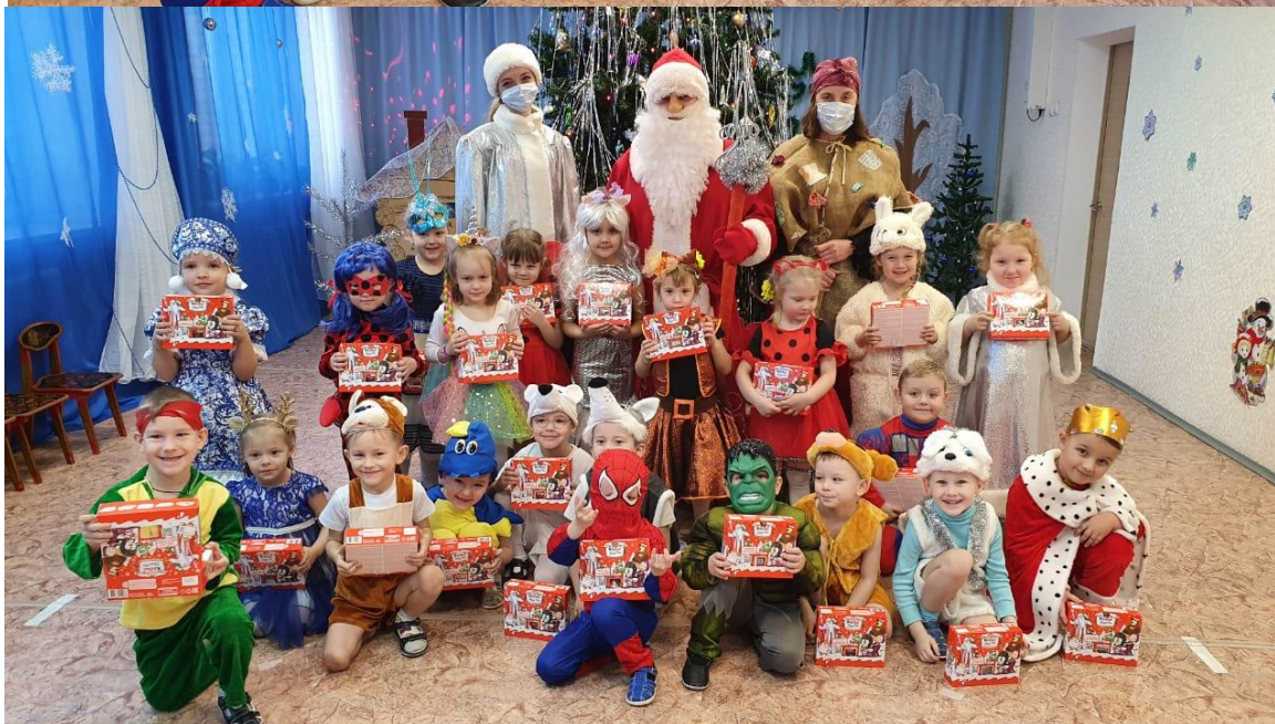
Итоговое мероприятие – новогодний утренник «Проказы Бабы Яги»