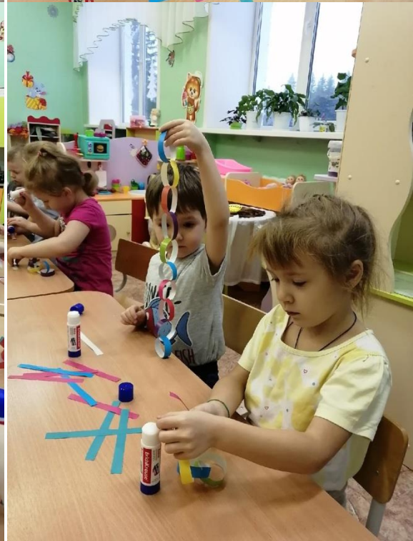
Конструирование из цветной бумаги «Новогодняя гирлянда»