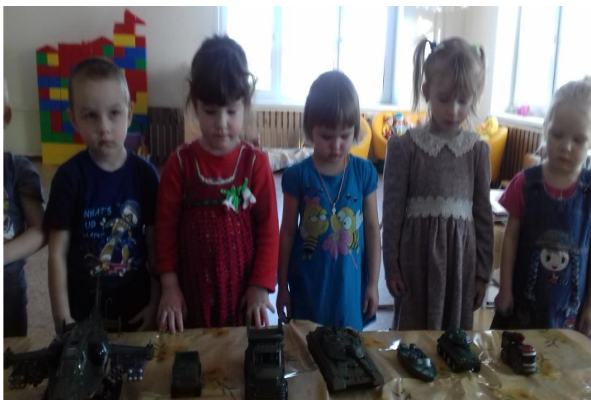
Кому , какой вид транспорта...