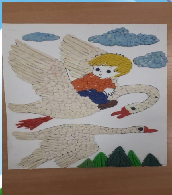
« Гуси- лебеди»