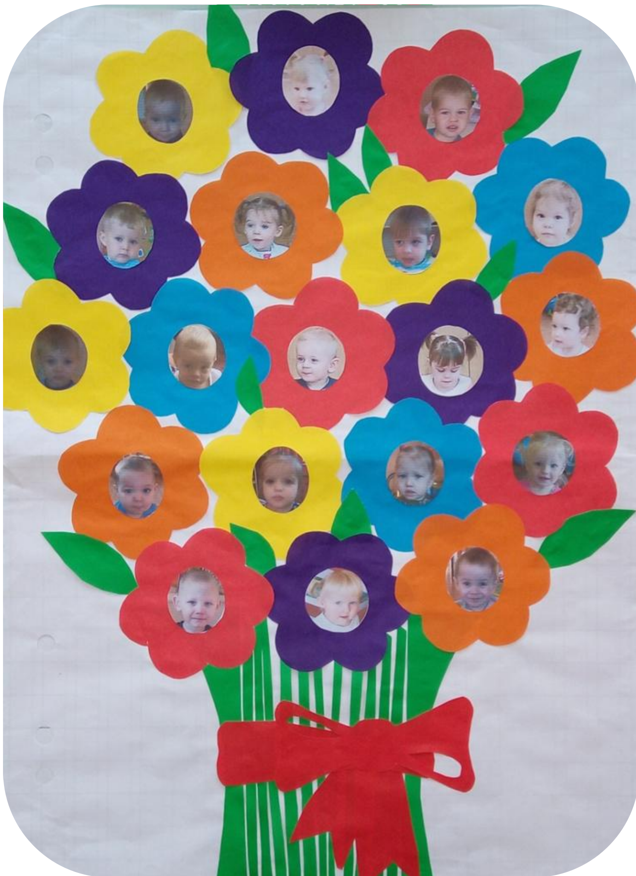
Рисование «Цветок для мамы» (подарок)