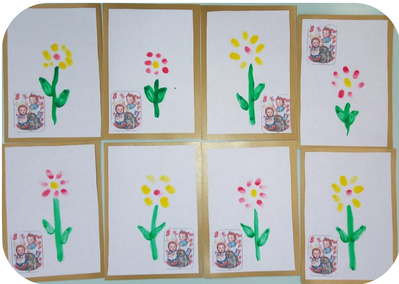
Выставка «Моя мама - рукодельница»