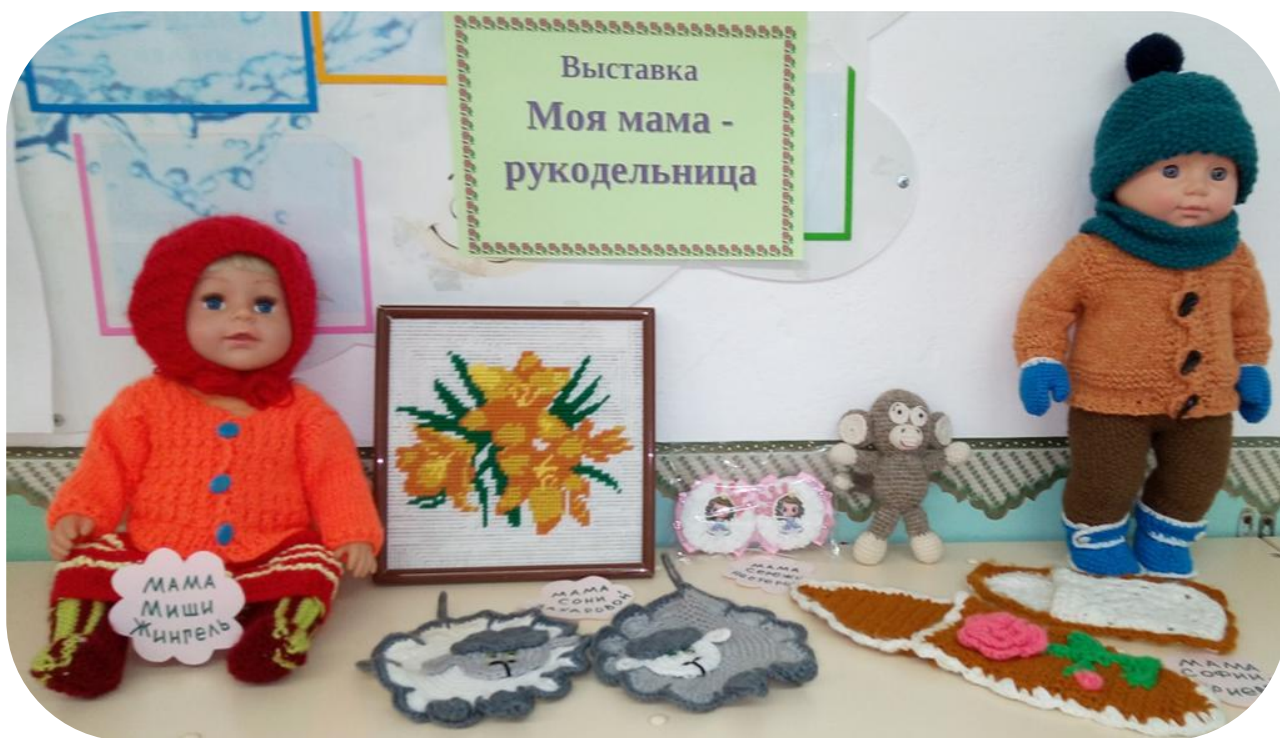
Фотогазета «Моя мама»