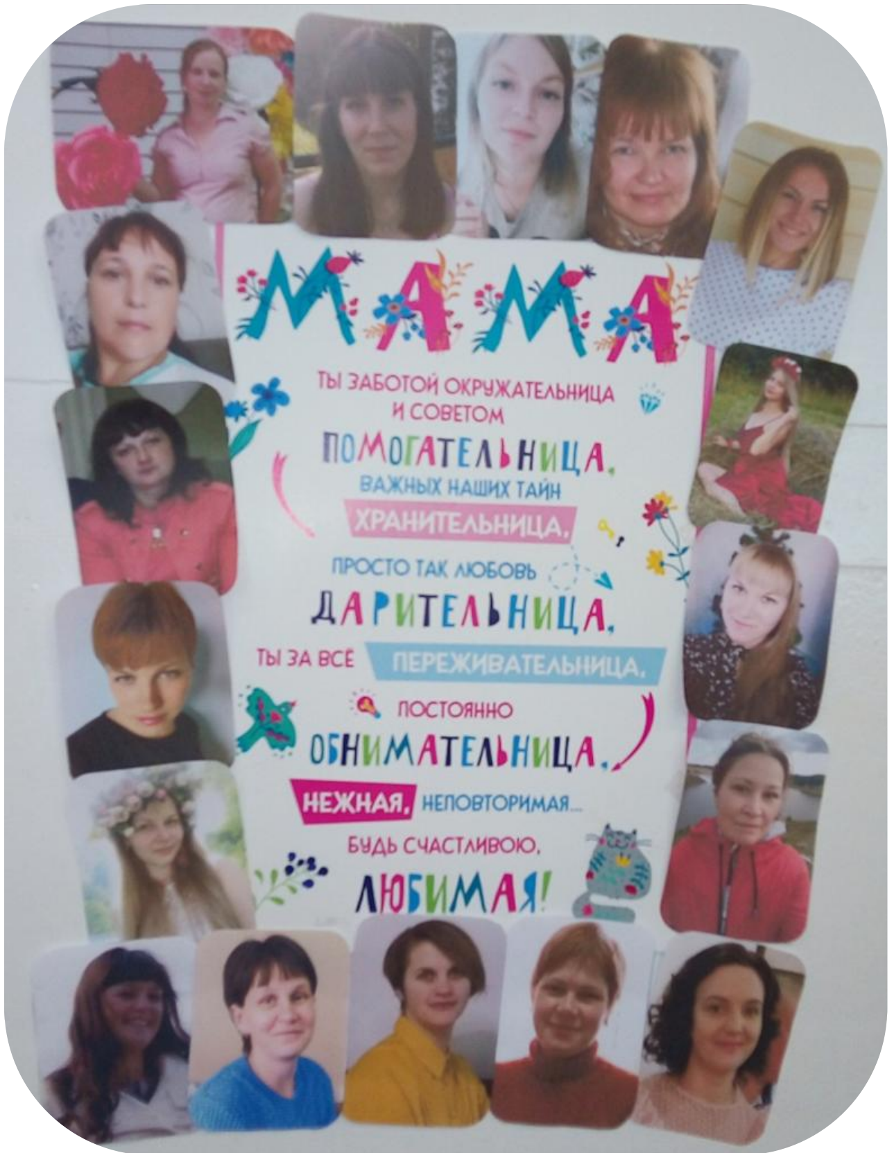
Развлечение «Поздравляем наших мам»