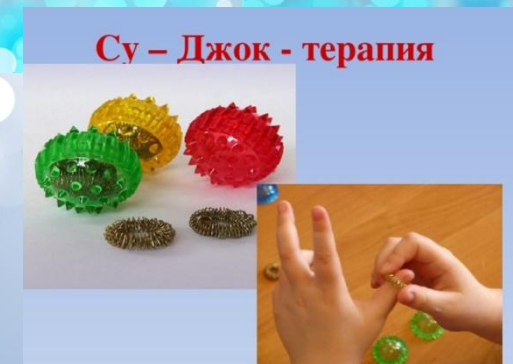
Су – Джок - терапия

«Су-Джок» с виду – симпатичный шарик с острыми шипами, лёгкий и гигиеничный, простой в обращении и доступный в любой момент. Если покатать его между ладонями – ощутите прилив тепла и лёгкое покалывание. Его остrokонечные выступы воздействуют на биологически активные точки, неизменно вызывая улучшение самочувствия, снимая стресс, усталость и болевые ощущения, повышая общий тонус организма.