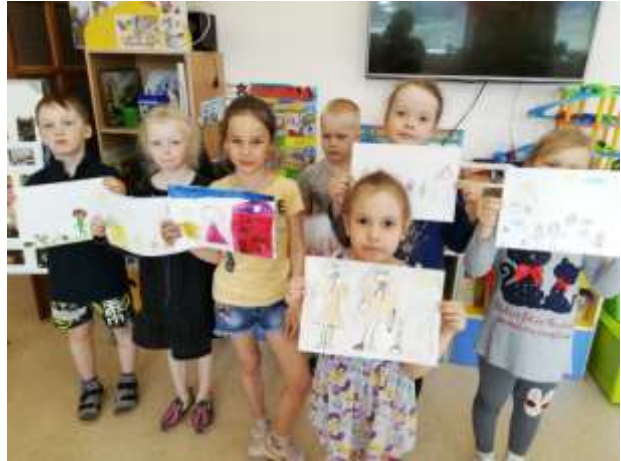
Строительные игры: «Дом, в котором я живу».