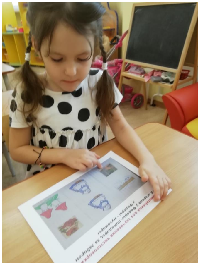
Составление описательного рассказа по теме "Дары осени"