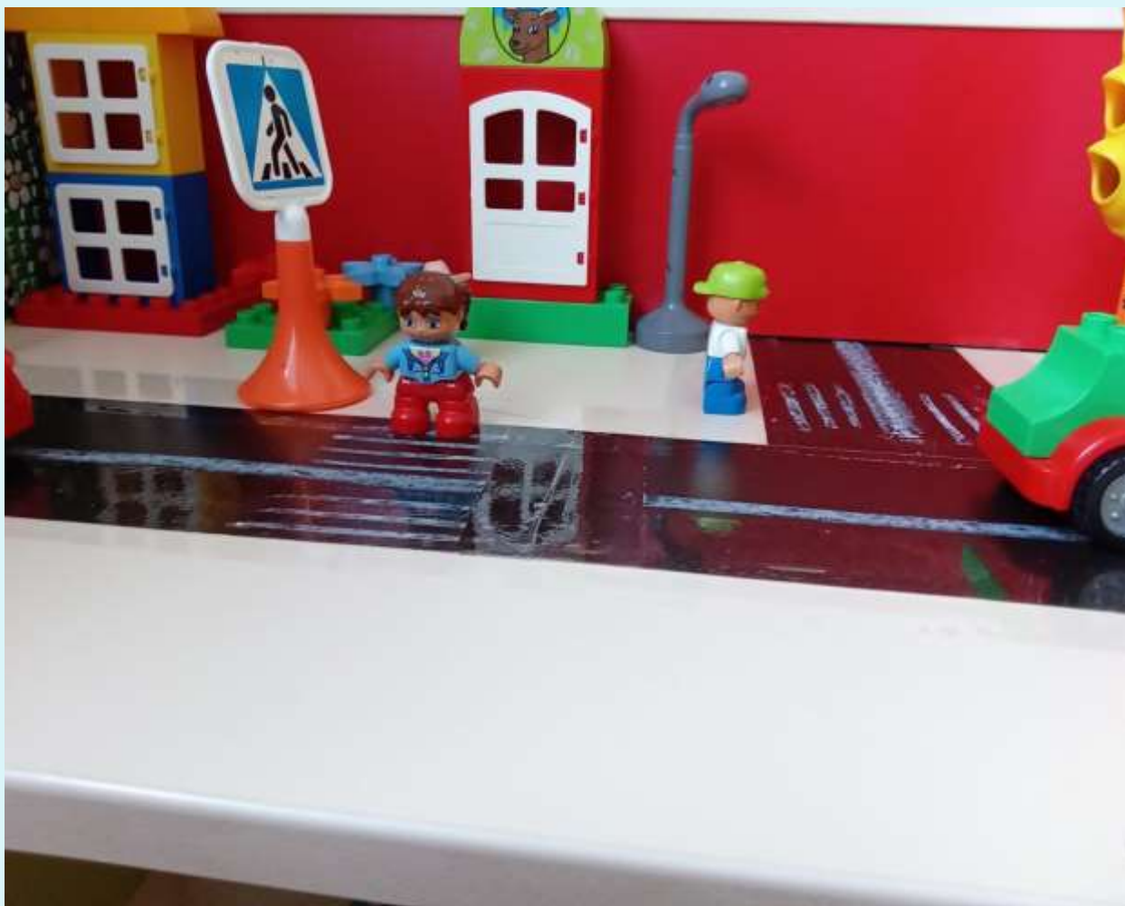
Макет «На дороге»

В целях пропаганды безопасности дорожного движения в группе создана развивающая предметно – пространственная среда