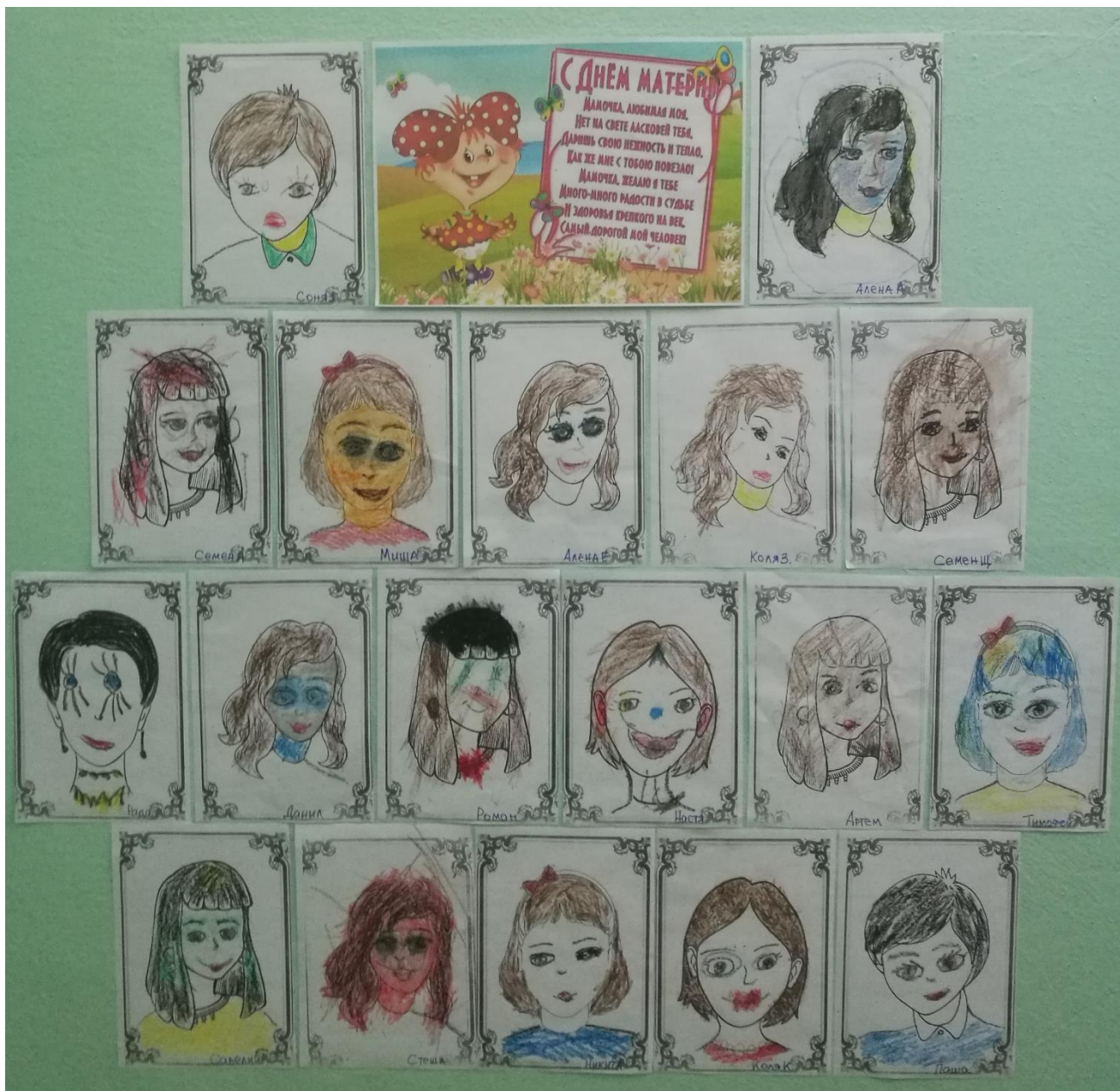
Фотовыставка «Мы с мамой нашей большие друзья»