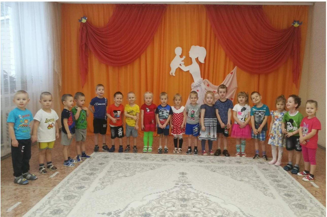
Спортивный праздник «Мамины помощники»