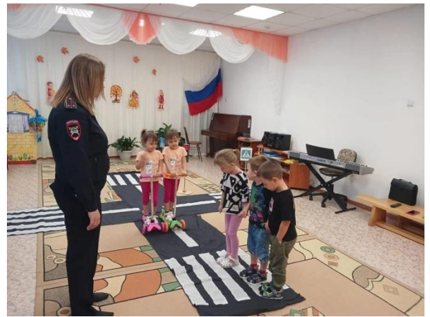
Экскурсии к перекрестку