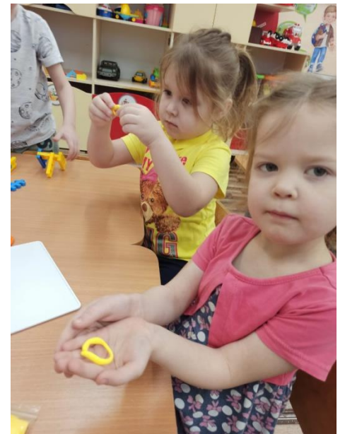
Ручной труд «Рождественский ангел»