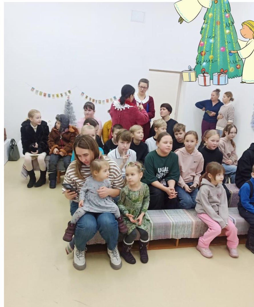
Посещение Музея истории Шалинского района, театрализованная постановка «Чистые сердцем»