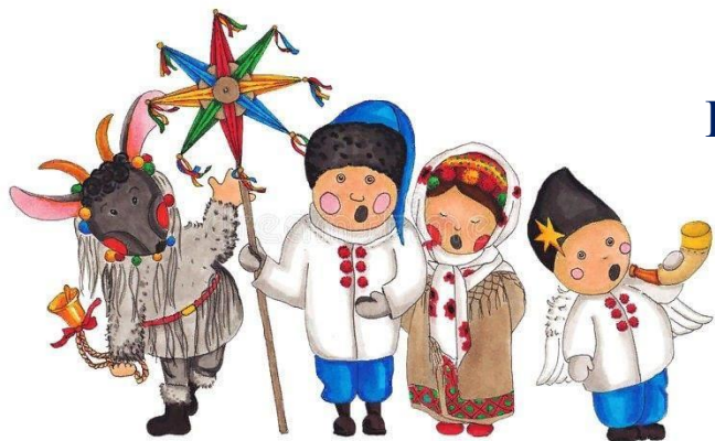
Колядки в семье