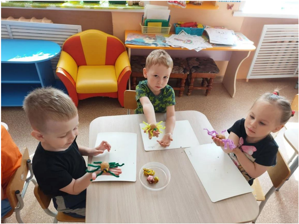
Дети отгадывали загадки о насекомых, играли в дидактические, пальчиковые и подвижные игры: